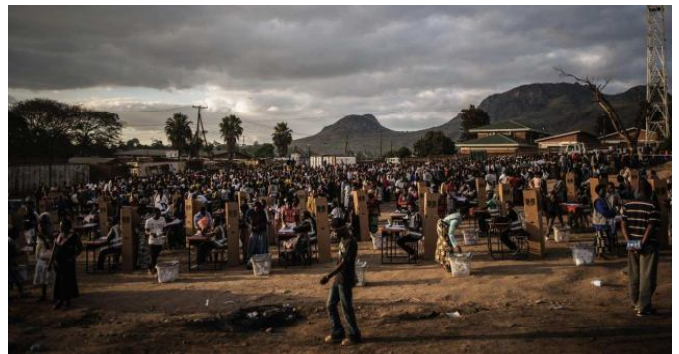
EL DÍA "D": LOS MALAWIES RECURREN A LAS URNAS A EMITIR SU VOTO.