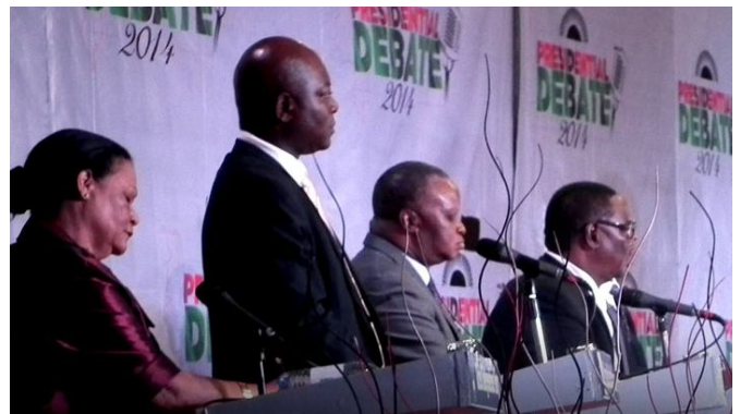
LOS CANDIDATOS PRESIDENCIALES DEBATIERON SOBRE LOS EJES PRINCIPALES DE LA POLÍTICA DEL PAÍS AFRICANO.

A sólo unas semanas de la asunción en su discurso inaugural pronunciado en la ciudad de Blantyre, el nuevo presidente de Malawi Peter Mutharika, pidió a todos los malawíes “unirse, olvidar el pasado y trabajar juntos para enderezar la economía del país”. El nuevo mandatario hizo referencia con respecto al saqueo de los recursos públicos al que los medios de comunicación calificaron de “Cashgate”. Sostuvo que su gobierno instituirá la tolerancia cero contra la corrupción por medio del fortalecimiento del departamento anticorrupción, la policía y otros órganos de aplicación de la ley. Asimismo Mutharika prometió establecer un gabinete austero