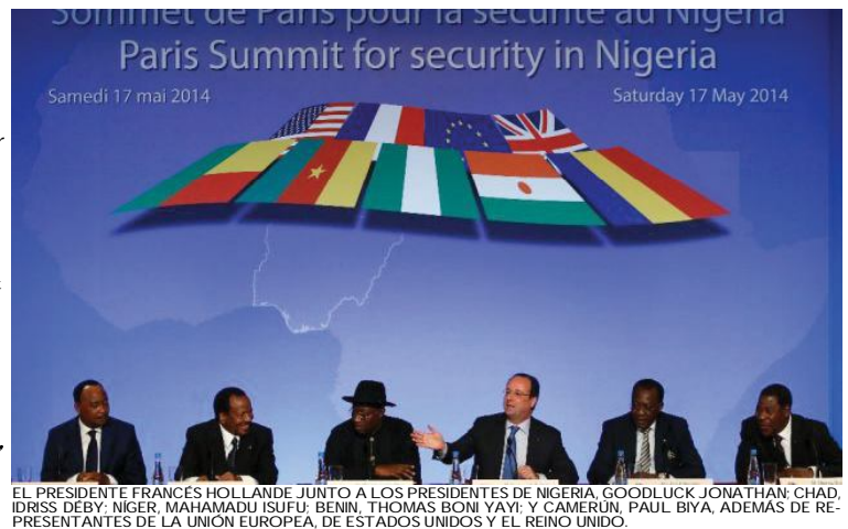
EL PRESIDENTE FRANCÉS HOLLANDE JUNTO A LOS PRESIDENTES DE NIGERIA, GOODLUCK JONATHAN; CHAD, IDRISSE DEBY; NIGER, MAHAMADU ISUFU; BENIN, THOMAS BONI YAYI; Y CAMERÚN, PAUL BIYA, ADEMÁS DE REPRESENTANTES DE LA UNIÓN EUROPEA, DE ESTADOS UNIDOS Y EL REINO UNIDO.

“Francia, Gran Bretaña y EEUU, respondieron ante el pedido de auxilio del presidente nigeriano, y se encuentran brindando apoyo militar en la región. Para algunos analistas se trata de una intervención indirecta, pero cuyo impacto no hay que perder de vista, teniendo en cuenta las recientes intervenciones en Egipto, Libia y Malí.”