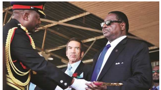
EL REGIMENTE ELEGIDO PRESIDENTE MATHURIKA SOSTIENE LA ESPADA DE MANDO CONFERIDO A EL POR EL COMANDANTE DE LA FUERZA DE DEFENSA MALAWI DURANTE LA INAUGURACIÓN OFICIAL DE SU MANDATO EN EL ESTADIO KAMUZI.

de 20 ministros para ahorrar dinero para los servicios sociales. Por último, en materia de Política Exterior el presidente malawí indicó que su gobierno fortalecerá las relaciones con países como China, Brasil, la India y Sudáfrica, entre otros, e invitó a los inversionistas extranjeros a Malawi, afirmando que el país africano se convertirá en un ambiente propicio y confiable para la IED ¿será posible?