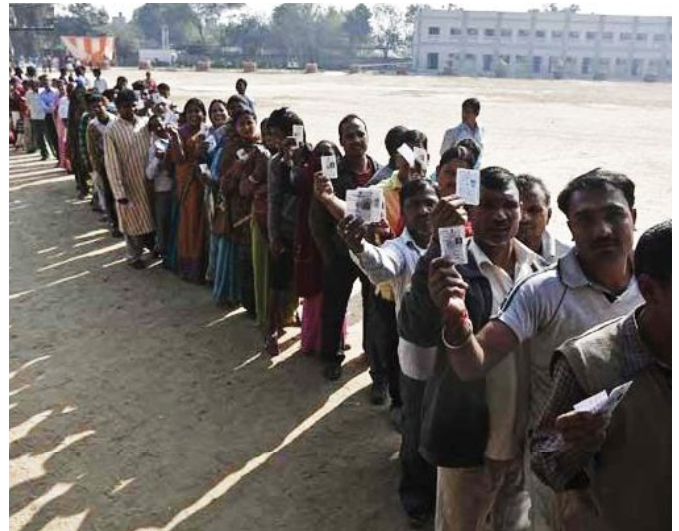
FILA DE VOTANTES ESPERANDO A SUFRAGAR.

Por último, las alternativas a estos bloques pueden cumplir un rol clave porque son las que podrían robarle votos al PG y al BJP. La principal es el "Tercer Frente", que aglutina a varios partidos regionales y comunistas que se definen como seculares y de izquierda y que sumados logran 92 escaños en el presente. El Partido Samajwadi (SP) es el más importante dentro del frente porque gobierna el estado más poblado de la India, Uttar Pradesh, convirtiéndose en la tercera fuerza más votada. Otra formación es el partido del Hombre Común (AAP), liderado por Arvind Kejriwal conocido como el "antico-