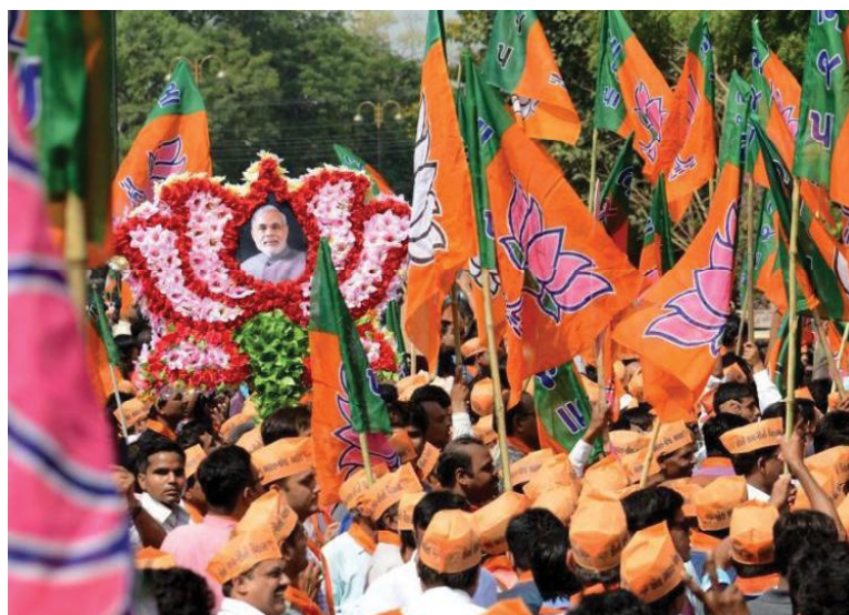
LA MULTITUD FESTEJA EN LAS CALLES EL CIERRE DE CAMPAÑA DEL FUTURO PRIMER MINISTRO.

“Modi ha logrado seducir con su modelo de desarrollo a una importante clase de empresarios, como así también ha captado a los jóvenes electores y a las clases medias urbanas cansadas y desconfiadas de la conducción tradicional del Partido del Congreso y sedientas por un sustantivo cambio político y económico.”